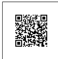
Zažádejte o vytyčení

Přílohy: Orientační zakres plynárenského zařízení, Detailní zakres plynárenského zařízení